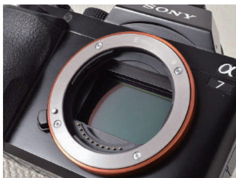
SONY E マウント

ミラーレス一眼カメラ本体のメーカーによって、カメラ側のレンズマウントの種類も異なります。