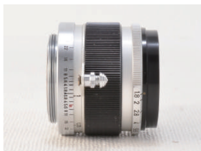
外観のキズ 絞り・ピントリングの故障

オールドレンズはすべて、作られてから長い時間を経た製品。そのため、ひとつとして同じ状態のものはありません。購入するときは、カビ・クモリ・キズなどの光学系のトラブル、ピントリングや絞りなど動作部品の故障に気をつけましょう。