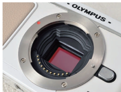
マイクロフォーサーズマウント (OLYMPUS / Panasonic)