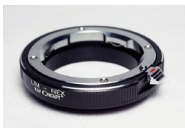
マウントアダプター で接続