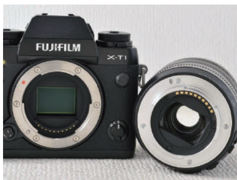
FUJIFILM X マウント