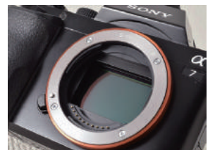
イメージセンサー

同じレンズを取り付けたときでも APS-C サイズ・マイクロフォーサーズでは 写真の中心部を切り抜いたのと同じ写りになる =同じレンズでも「望遠レンズ」に近くなる